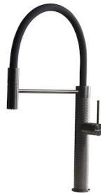
Mitigeur Skin Gun Metal