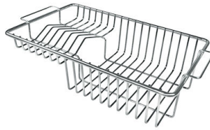
Panier à vaisselle inox

* uniquement en combinaison avec l'accessoire 8644 101